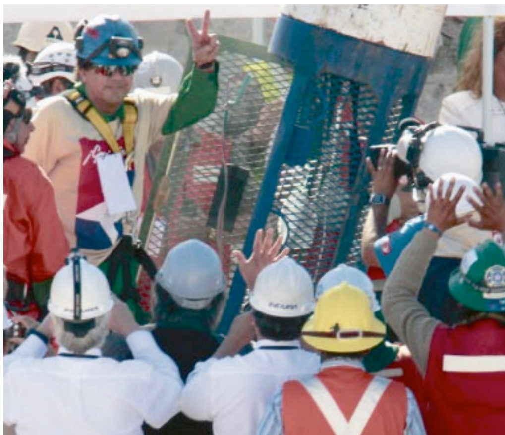
TRANGT. Denne uken ble de chilenske gruvarbeiderne reddet opp gjennom en 622 meter dyp - og ikke spesielt romslig - sjakt.